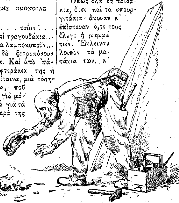
«Ένας ἐργάτης σκεπάζει τὰ πουλάκια με τὸ κασκέτο του.»

'Ὅπως ὅλα τὰ παιδα- κια, ἔτσι καὶ τὰ σπουρ- γιτάκια ἄκουαν κ' ἐπίστευαν ὅ,τι τοὺς ἔλεγε ἡ μαϊμά των. 'Ἐκλείναν λοιπὸν τὰ μα- τάκια των, κ'