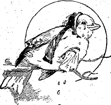
« Κλαίει καὶ δάδρευται. »

ἔκαμναν νάνι' καὶ ὕστερα πάλιν ἐξυπνοῦ- σαν καὶ ἄρχιζαν νὰ φιλιοῦνται καὶ νὰ κελαδοῦν: